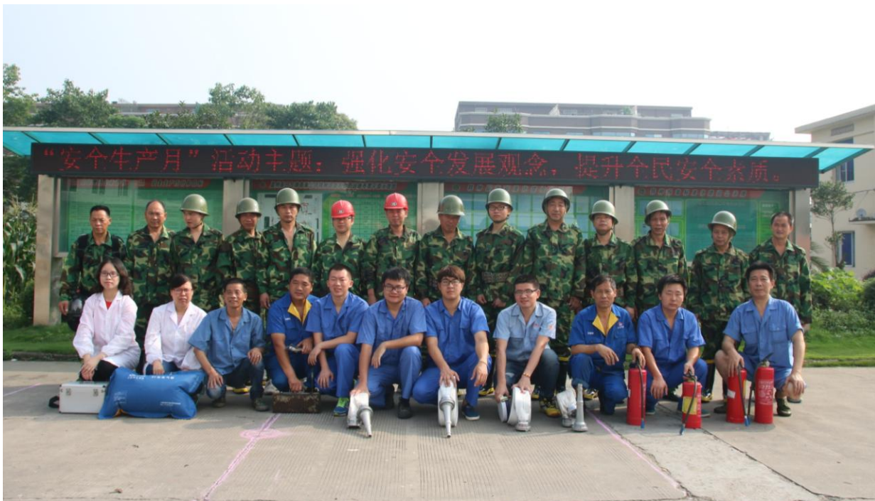
图为：温州东日气体有限公司开展生乙炔充装间发生乙炔泄漏燃烧事故的应急处置和应急救援演练活动